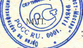
Схема сертификации - № 3.

Форма и размер знака по ГОСТ Р 50460-92.